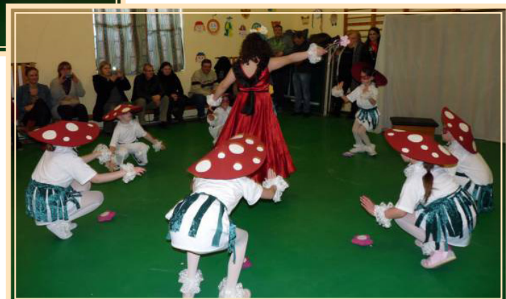
4. helyezés: 1-2. osztály "Tavaszi tündér"