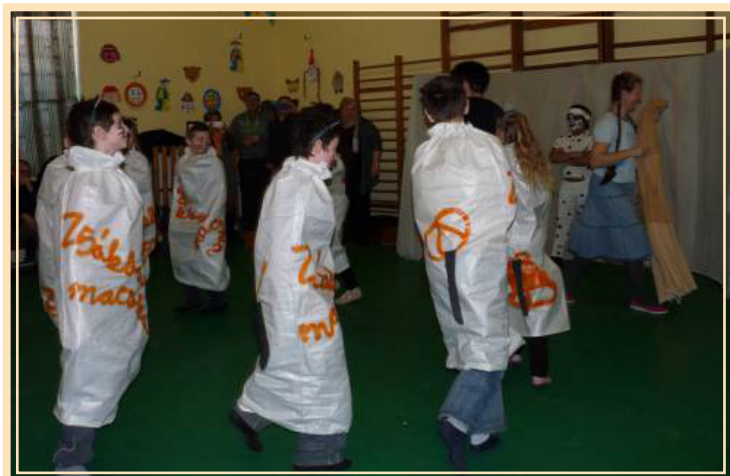
1. helyezés: 4. osztály "Zsákba macska"