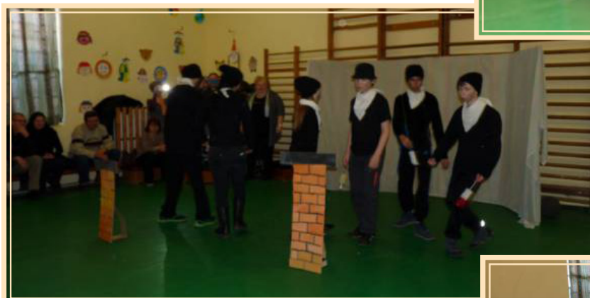
3. helyezés: 5-8. osztály "Kéményseprők"